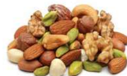
Mix de frutos secos