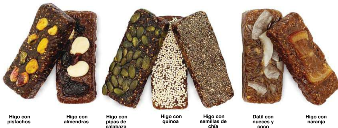
Higo con pistachos